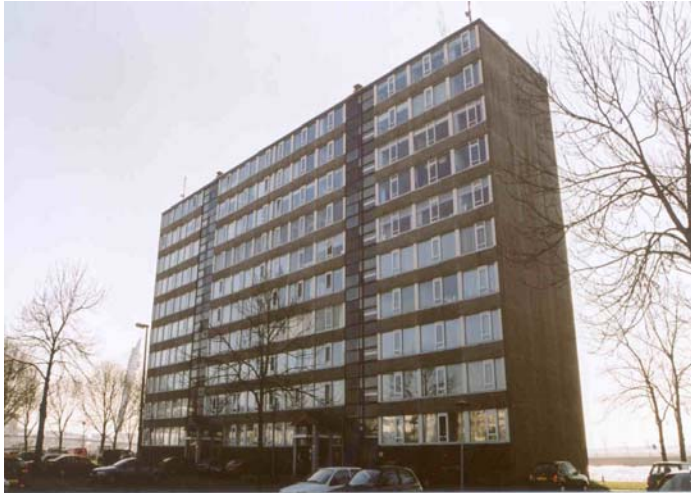
Foto: Kanaleneiland Utrecht

‘Worden maatschappelijke kansen bepaald door degene die naast je wonen? Gedeeltelijk wel, maar denk eens aan uw eigen werk. Wat is de bepalende factor van uw huidige werksituatie? Heeft dat iets te maken met uw burenen?’